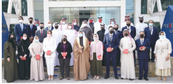
2030. جاء ذلك لدى تسليمه أمس «وسام الأمير سلمان بن حمد للاستحقاق الطبي» للكوادر الوطنية المشاركين في الجهود الوطنية للتصدي للفيروس من منتسبي الوزارة وشركة مطار البحرين وهيئة تنظيم الاتصالات.

الاتصالات، إنفاذاً للأمر الملكي السامي وفي إطار توجيه صاحب السمو الملكي ولي العهد رئيس مجلس الوزراء لكافة الجهات المعنية بتسليم الوسام للعاملين في الصفوف الأمامية من الكوادر الصحية، وقوة دفاع البحرين، ووزارة الداخلية، وكافة الجهات المساندة. وهذا الوزير الحاصلين على الوسام، مثنياً الجهود الكبيرة التي قدمها منتسبو الوزارة وشركة مطار البحرين وهيئة تنظيم الاتصالات، والتي تدعم جهود «فريق البحرين» في التصدي لفيروس كورونا. متمنياً لهم دوام التوفيق والنجاح لما فيه خير ومصالح للوطن. فيما أعرب منتسبو الوزارة عن الاعتزاز والفخر بهذا التكريم السامي وما يمثله من دافع كبير وحافز لبذل المزيد من العطاء وخدمة الوطن في كافة المجالات، مؤكداً أن الوسام يعد شرفاً لكل من حصل عليه وأمانة ومسؤولية تتطلب مواصلة تقديم الأفضل دائماً، مشيدين بما يحظون به من دعم ومساندة وتوجيهات مستمرة من قبل سعادة وزير المواصلات والاتصالات.